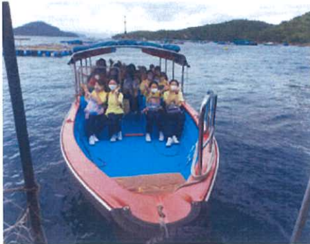
2022 年 6 月 2 日初中學生在導師帶領下到魚排參觀

舉辦兩次生態遊是免費的，於 2022 年 6 月 2 日安排初中學生進行參觀，透過互動的方式使他們更能認識海洋及學會珍惜自然環境。於 2022 年 6 月 27 日安排 IVE 設計系同學進行參觀，由於上次由他們設計 XO 醬及小食包裝的設計，讓更多同學了解及參與。