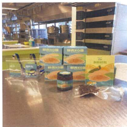
珍珠蚌肉 XO 醬包裝盒製成品