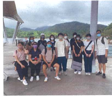
2022 年 6 月 27 日 IVE 設計學系學生到魚排參觀