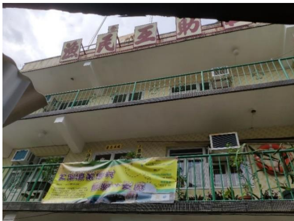
安排舉辦體驗活動之大澳漁民互助社外觀(1)

準備開始深度旅遊團前，本司連同旅行社職員前往位於大澳香港漁民互助社與擔任導賞員的漁民會面，溝通一下如何安排體驗活動的流程及內容，以便配合旅行社整體行程流暢，令參加的旅客更易了解過往漁民漁業經驗，同時會適時與導賞員提供改進意見，希望不斷改進令漁民導賞員掌握解說技巧。同時進行深度遊時，會安排旅客自費購買大澳特產(如蝦膏、參茸海味等)帶動當地經濟。