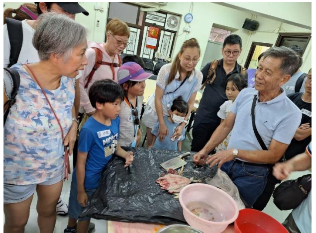
大澳漁民導賞員示範及講解鹹魚製作過程