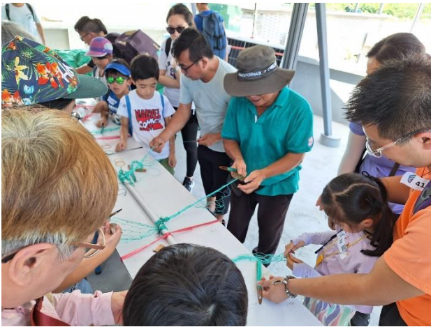
旅客體驗製作編織漁民捕魚工具