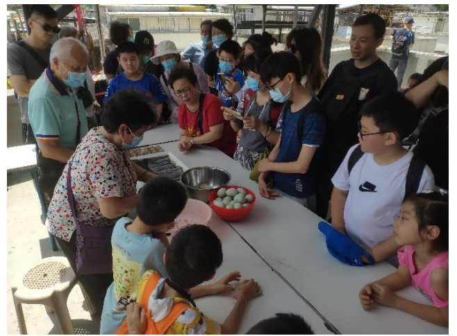
大澳漁民導賞員製作鹹蛋黃示範