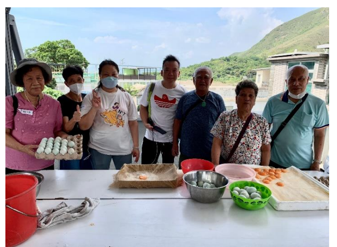
旅客完成體驗與漁民合照