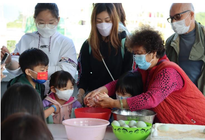
旅客親身體驗製作鹹蛋黃