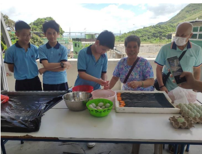
旅客親身體驗製作鹹蛋黃