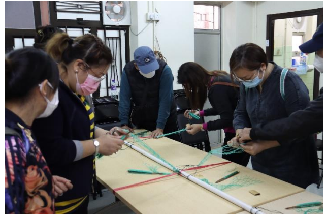
旅客體驗製作編織漁民捕魚工具