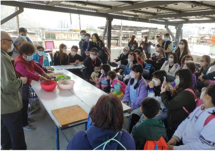
大澳漁民導賞員製作鹹蛋黃示範