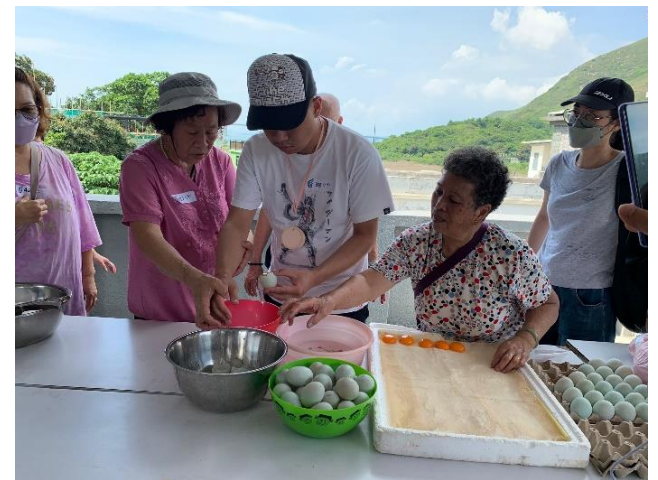
旅客親身體驗製作鹹蛋黃