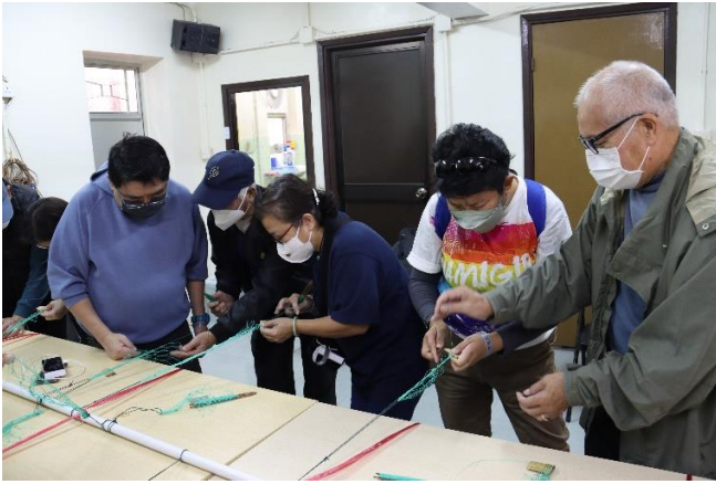
旅客體驗製作編織漁民捕魚工具