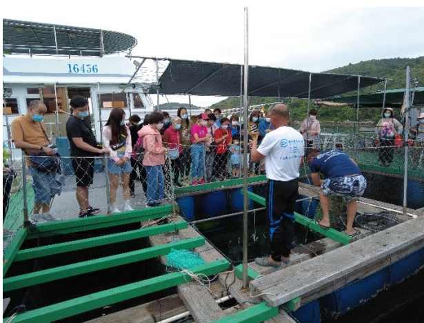
漁民講解養殖珍珠實況