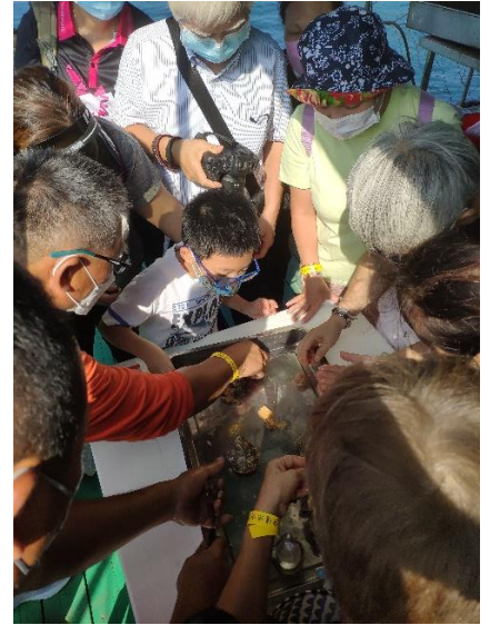
旅客體驗開採珍珠過程