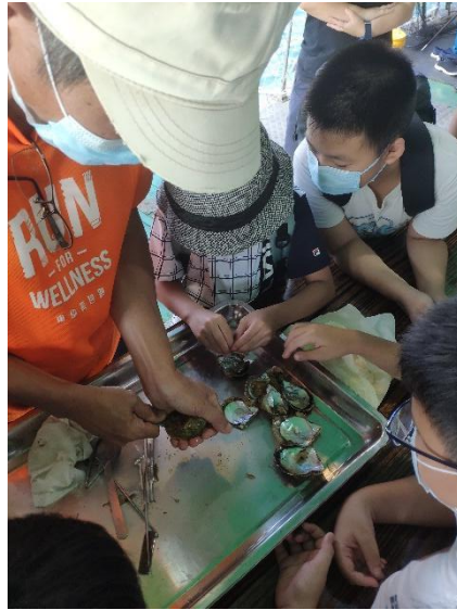
旅客體驗開採珍珠過程