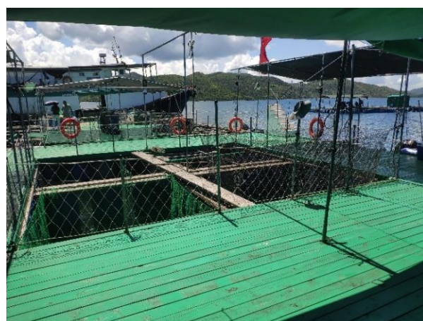
西貢深涌珍珠養殖漁排實況