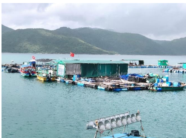
安排舉辦體驗活動之西貢深涌珍珠養殖漁排外觀

進行深度遊前，本司工作人員及漁民會先彩排，以確保介紹及講解時簡單易明，亦建議適當分享漁民的經驗趣事，令整個導賞活動更有趣。在活動完結後，會與漁民一起檢討當天的行程，希望下次能安排得更好。