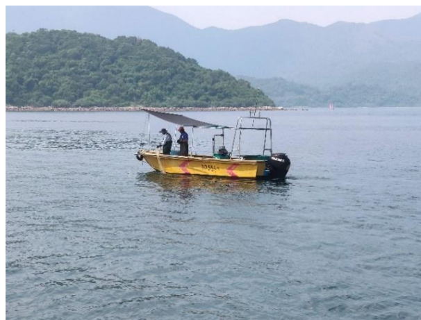
旅客在客船上遠觀漁民捕撈過程