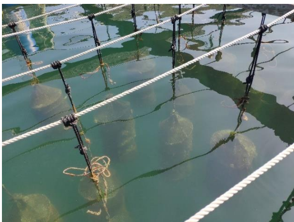
漁排養殖珍珠的實況