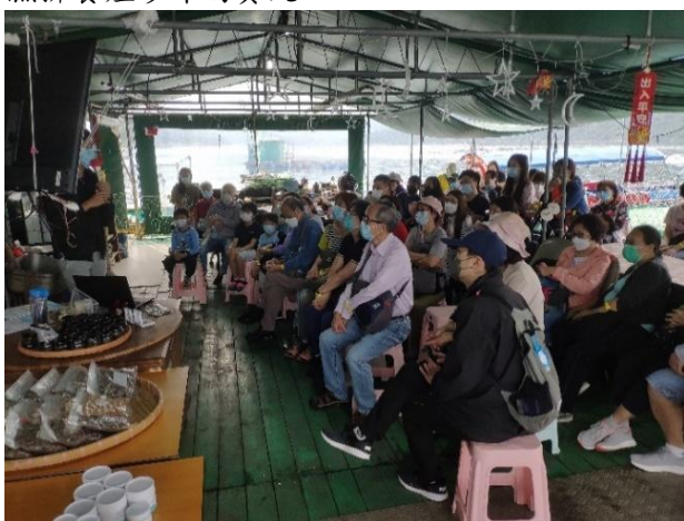
由年青漁民導賞員向旅客講解養殖珍珠過程