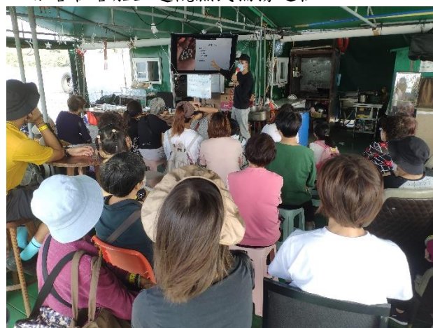
由年青漁民導賞員向旅客講解養殖珍珠過程