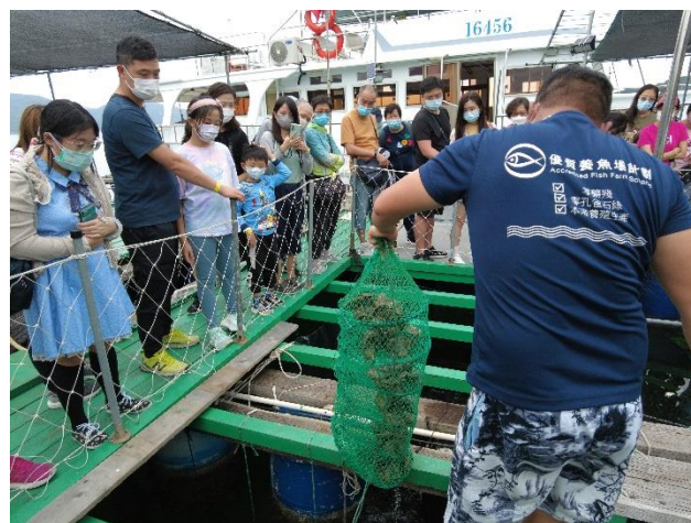
漁民講解養殖珍珠實況